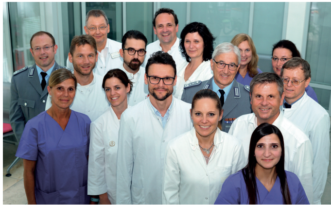
Das Team des Beckenbodenzentrums